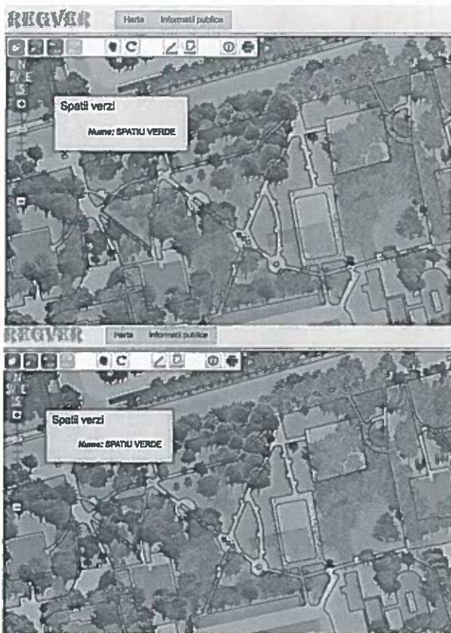
Imagine Parc Brâncuși